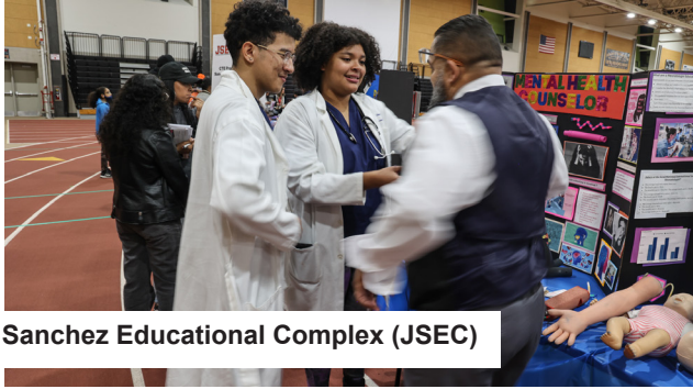
Juanita Sanchez Educational Complex (JSEC)

نداء إلى جميع طلاب المدارس الثانوية المبدعين في Providence Public School انضم إلى مسابقة إنشاء شعار Sodexo وأظهر لـ Sodexo تحفك الأصلية. تتطلع Sodexo Providence إلى إنشاء شعار جديد يعكس موضوع "Rooted in Providence" يجب أن تتضمن الإدخلات اسم "Rooted in Providence"، وأن تكون ذات صلة بالغداء المدرسي، وأن تكون عملاً فنيًا أصليًا. الفائز يحصل على جائزة قدرها 5000 دولار! أرسل تصميمك بصيغة pdf بحلول 26 فبراير 2024 إلى liana.borts@foodsorps.org . سيتم الإعلان عن الفائز في 19 مارس.