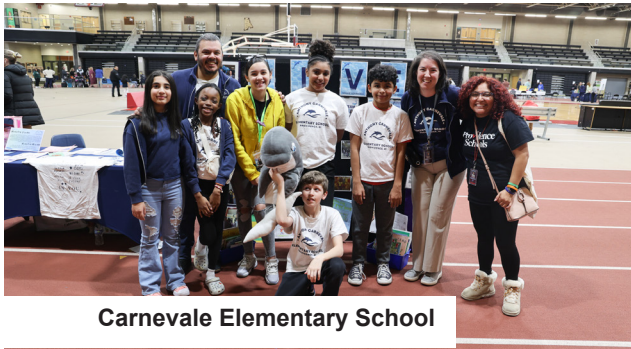
Carnevale Elementary School